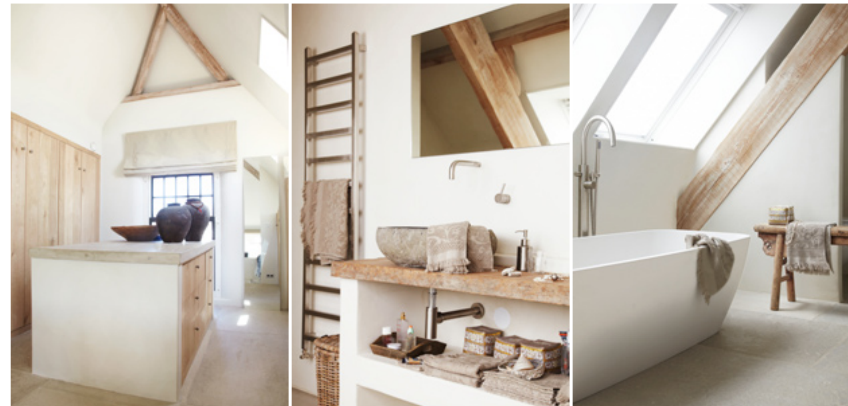
Foto linkerpagina: Wytske wilde absoluut een muurtje achter haar bed, dus plaatsten ze er eentje van gips. Achter het muurtje leidt een trap naar de hoger gelegen dressing. Foto links: de ingebouwde kasten van de dressing werden gemaakt door de vader van Wytske, die vroeger timmerman was. Foto's midden en rechts: de wastafel in de badkamer van Wytske en Peter komt uit Bali. De houten plank vond Wytske bij Hoffz, ze was er helemaal weg van. Iedereen vroeg zich af waarom, totdat ze het eindresultaat zagen. Het bad is van Jee-O.

Door een maximaal gebruik van natuurlijke materialen en zachte kalkverven kreeg de woning een sobere, maar stijlvolle aanblik mee. “Mijn stijl straalt veel rust en warmte uit, doordat ik veel kleuren en materialen laat herhalen. Maar graag voeg ik ook iets verrassends toe en grijp ik vaak terug naar authentieke elementen”, legt Wytske uit. “Neem nu bijvoorbeeld het toiletje. Daar hangt een heel oude kraan, maar ik heb die wel op een moderne manier geïntegreerd.” Dat het regelmatig terugkomen van vele elementen bijdraagt tot het rustgevend effect van het huis is ons onmiddellijk duidelijk. Zo vormen vooral beton, hout en kalkverven de materialen die als een rode draad door het huis lopen. “Ik heb de basis bewust heel rustig gehouden. Om een bepaalde sfeer te creëren, gebruik ik graag potten met bloemen, kussens en unieke woonaccessoires. Zo is het heel gemakkelijk om een bestaande sfeer volledig te veranderen naar een ander thema. Door de seizoenen terug te laten komen in de print van de kussens op de bank kun je al een hele ander sfeer creëren.”