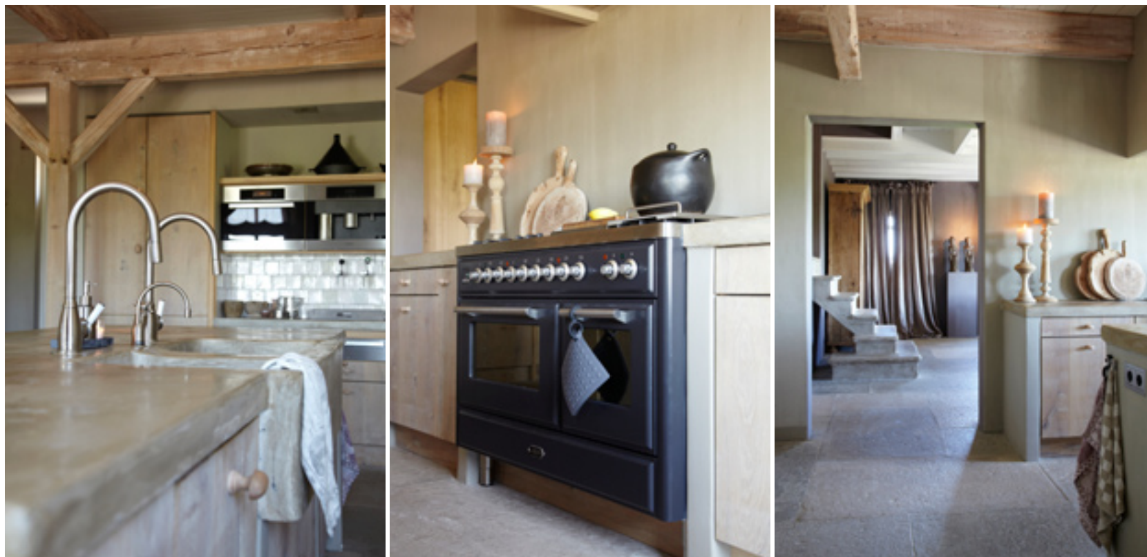
Foto rechts: de houten beeldjes op de achtergrond zijn meegebracht uit Bali en symboliseren een getrouwd echtpaar. Omdat er vroeger niet de mogelijkheid was om een foto van het bruidspaar te maken, kregen zij als aandenken een uit hout gesneden afbeelding van hun eigen gestalte. De kandelaars zijn van Life Style, de houten snijplanken van Hoffz.

In april 2008 ging het koppel over tot de aankoop en kon het beginnen met de plannen. Want hoewel de basis identiek zou blijven aan de ori-