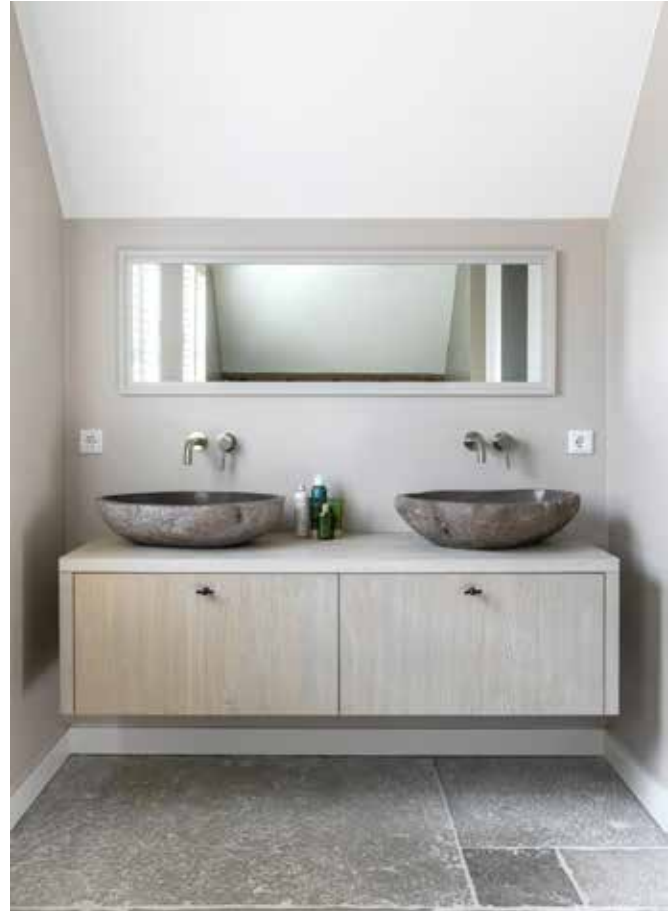
Op de vloer van de badkamer liggen Castle Stones. Op de wand zit betonstuc, aangebracht door de lokale stukadoor. Op de andere wanden zit normaal stucwerk met daarop de verfkleur Elephant's Breath van Farrow & Ball. Het wastafelmeubel is gemaakt door Strakk in dezelfde stijl als de keuken. De waskommen zijn van natuursteen.

“Dagen en nachten hebben we in weer en wind aan ons huis gebouwd”