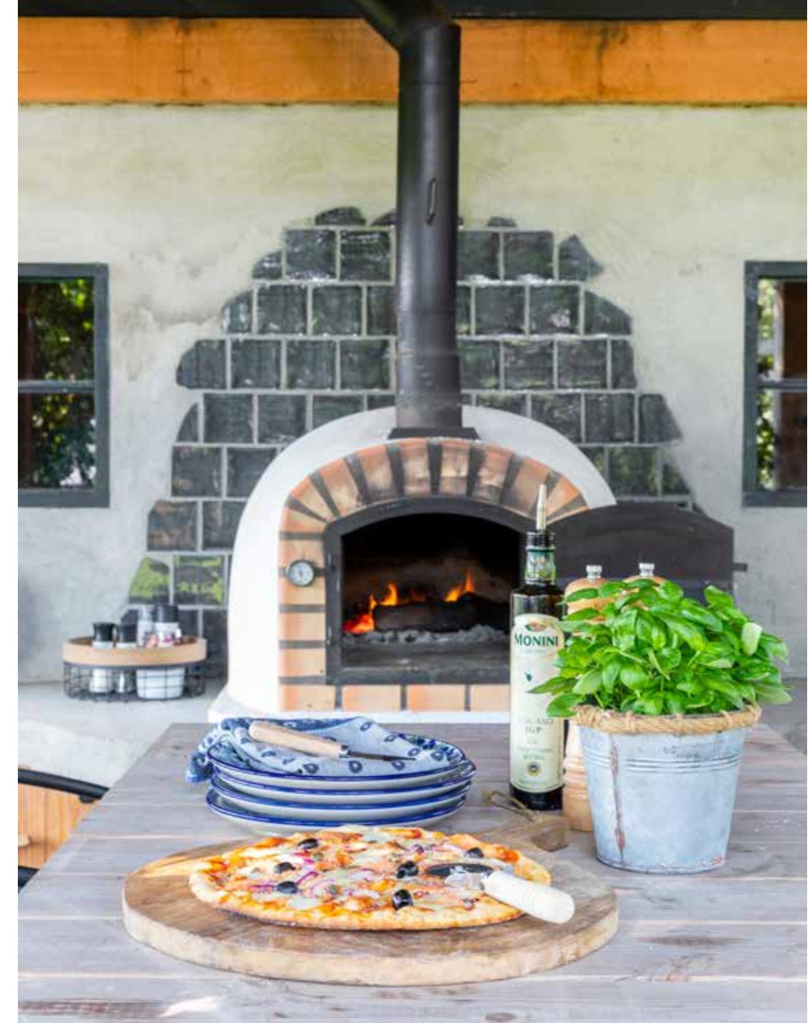
Ook voor etentjes buiten haalt Kim graag haar blauwe Bunzlau Castle-servies tevoorschijn.

En de kleur beige, taupe of zand komt overal terug, dat verveelt nooit en blijft favoriet. Verder vind ik het leuk om dingen met een verhaal te gebruiken in ons interieur. Zo heb ik links en rechts oude meubels en gebruiksvoorwerpen van onze families een plek gegeven. En heb ik door Bas de bodem uit afgedankte melkbussen laten zagen en daar lampen van gemaakt voor boven onze eettafel. Mooi toch, zo'n tweede leven voor iets wat eigenlijk niet meer gebruikt wordt."