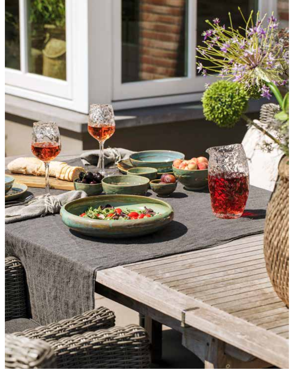
Alle decoratie op de gedekte tafel en de kussens vonden Emmy en Edwin bij Puur Wonen.