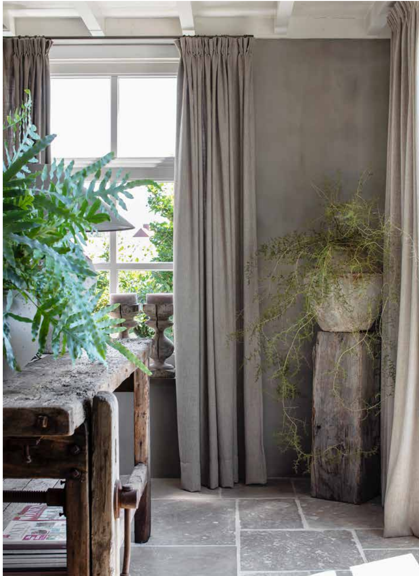
De keuken en woonkamer werden geschilderd met kalkverf Dried Clay van Pure & Original. Alle gordijnen in huis komen van Meu Beijafloor Design.