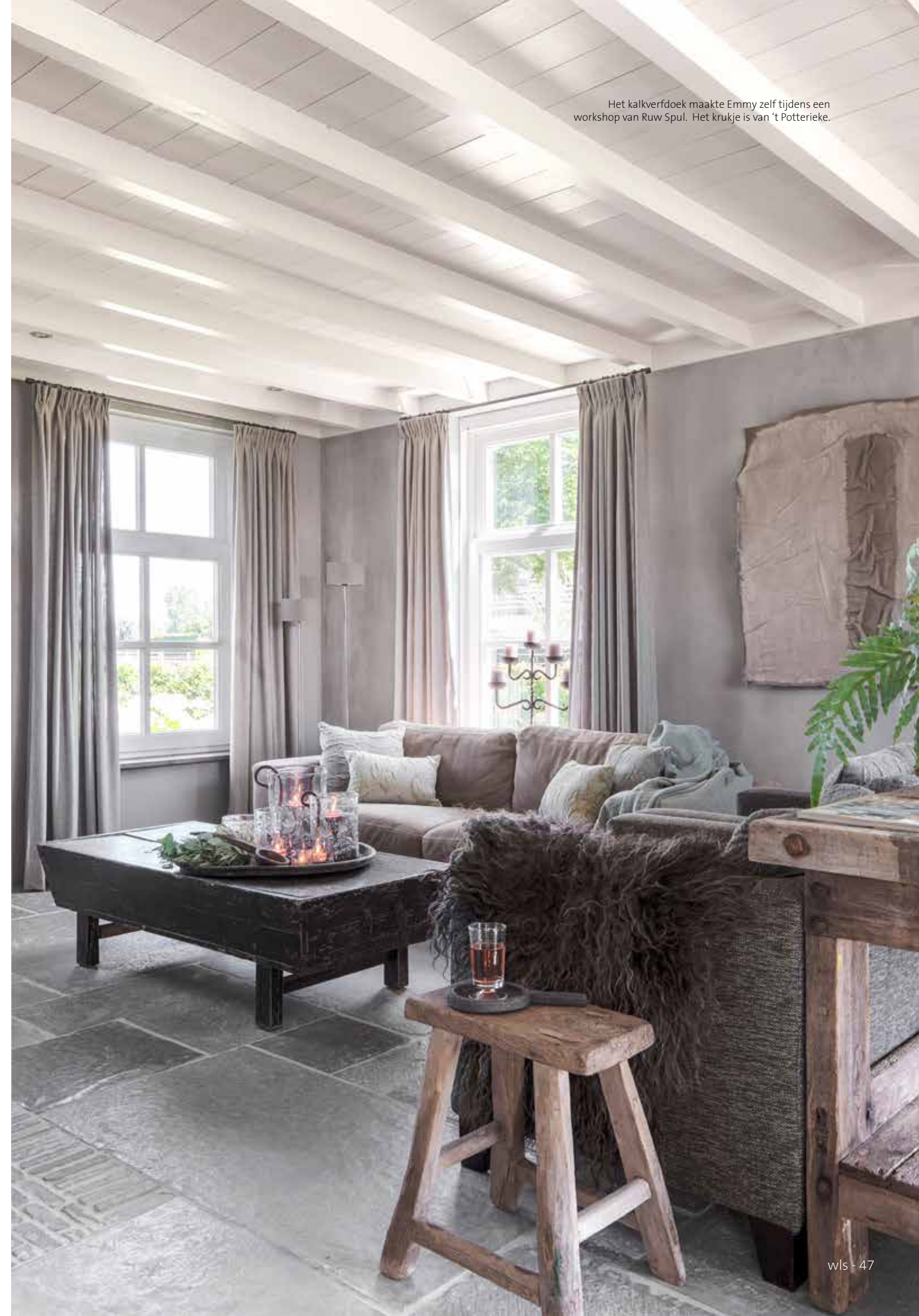
Het kalkverfdoek maakte Emmy zelf tijdens een workshop van Ruw Spul. Het krukje is van 't Potterieke.