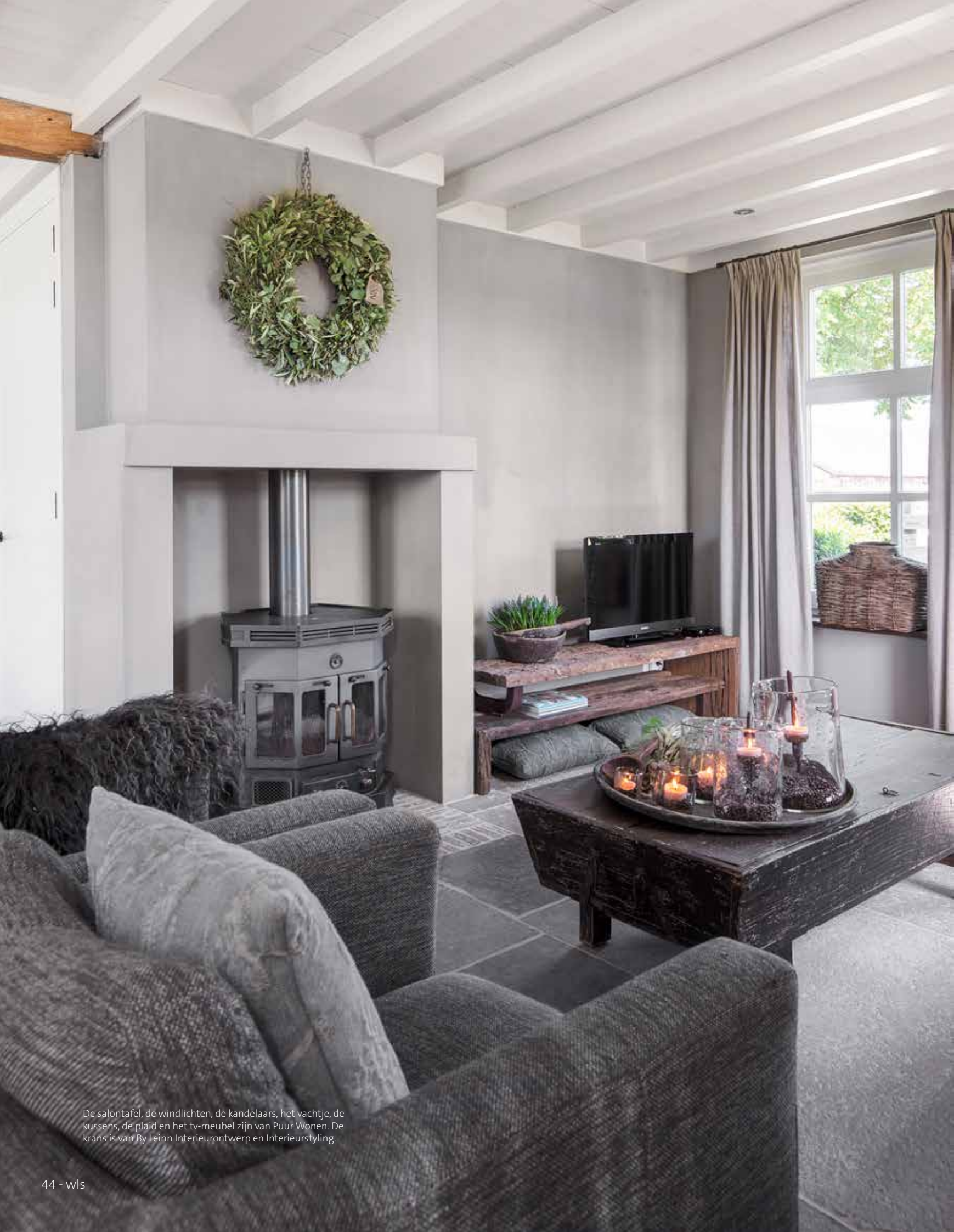
De salontafel, de windlichten, de kandelaars, het vachtje, de kussens, de plaid en het tv-meubel zijn van Puur Wonen. De krans is van By Leinn Interieurontwerp en Interieurstyling.

De werktafel kocht Emmy van de opa van een vriendin. De kruiklamp erop is van Puur Wonen, net als de rieten mand naast de kast. De kast zelf is een Marktplaats-vondst.