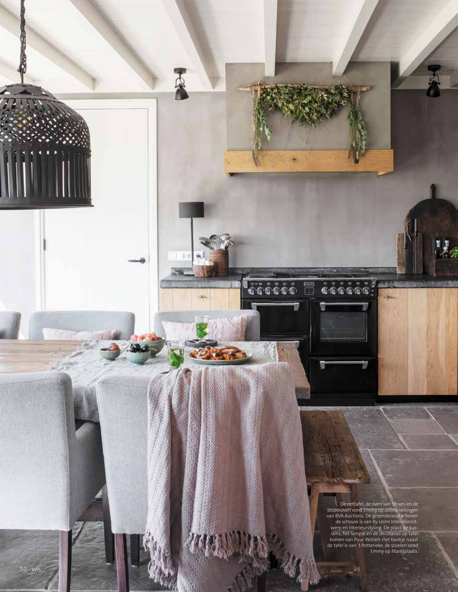
De eettafel, de oven van Stoves en de stoomoven vond Emmy op online veilingen van BVA Auctions. De groendecoratie boven de schouw is van By Leinn Interieurontwerp en Interieurstyling. De plaid, de kussens, het lampje en de decoraties op tafel komen van Puur Wonen. Het bankje naast de tafel is van 't Potterieke, de stoelen vond Emmy op Marktplaats.