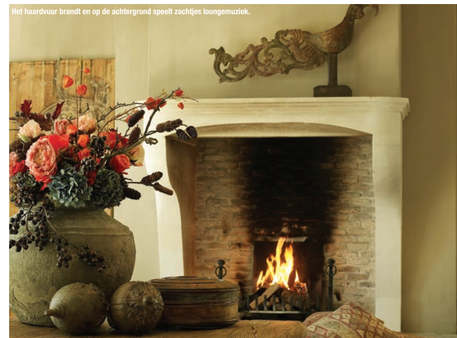
Het haardvuur brandt en op de achtergrond speelt zachtjes loungemuziek.

We zien veel gebleekt eiken en zachte kalkverven waardoor de woning een sobere maar toch chique uitstraling krijgt