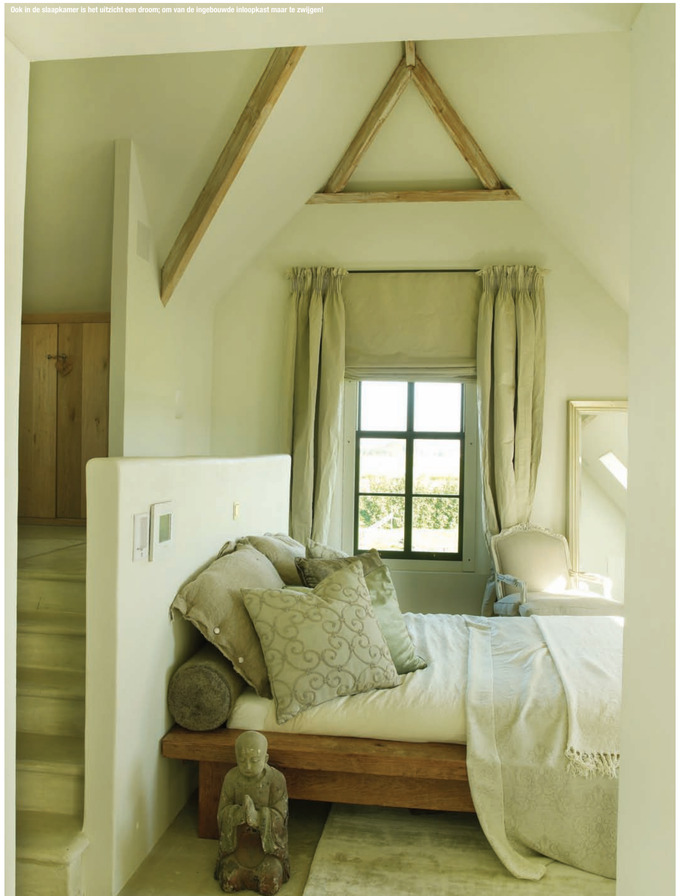
Ook in de slaapkamer is het uitzicht een droom; om van de ingebouwde inloopkast maar te zwijgen!

Wat opvalt is het consequent gebruik van natuurlijke materialen en vooral de houten balken die in tact zijn gebleven. We zien veel gebleekt eiken en zachte kalkverven waardoor de woning een sobere maar toch chique uitstraling krijgt. Wytske vertelt dat ze zelf op een trapje uren heeft staan boenen en verf staan mengen totdat ze de gewenste verweerde uitstraling van de balken kreeg. De woonkamer bevindt zich nu op de plek van de voormalige koeienstallen in de boerderij. Dat verklaart het aantal balken en ramen aan weerskanten. De kleine ramen aan de kant van de tuin heeft Wytske vervangen door hoge, stalen frames met grote glaspartijen zodat je een weids uitzicht hebt over de polders en de tuin. Elk meubel heeft een verhaal; zo is de salontafel gemaakt van een oude gevangenisdeur uit India en kan er een film bekeken worden op het grote scherm dat met een druk op de knop uit het plafond zakt. Uiteraard is het Peters verdienste dat audio en verlichting hier zorgen voor een bioscoopgevoel.