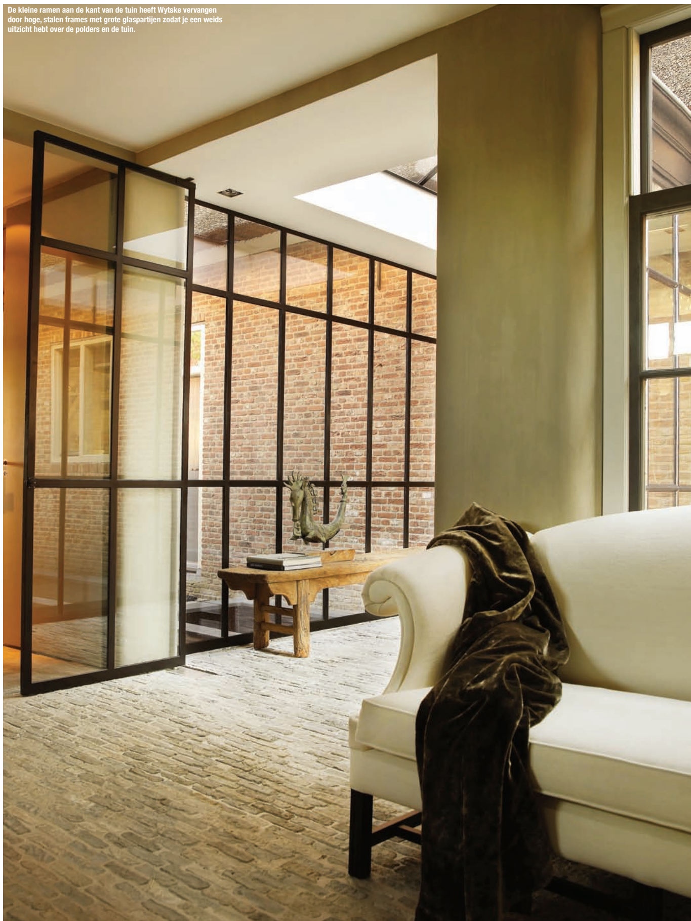
De kleine ramen aan de kant van de tuin heeft Wytske vervangen door hoge, stalen frames met grote glaspartijen zodat je een weids uitzicht hebt over de polders en de tuin.