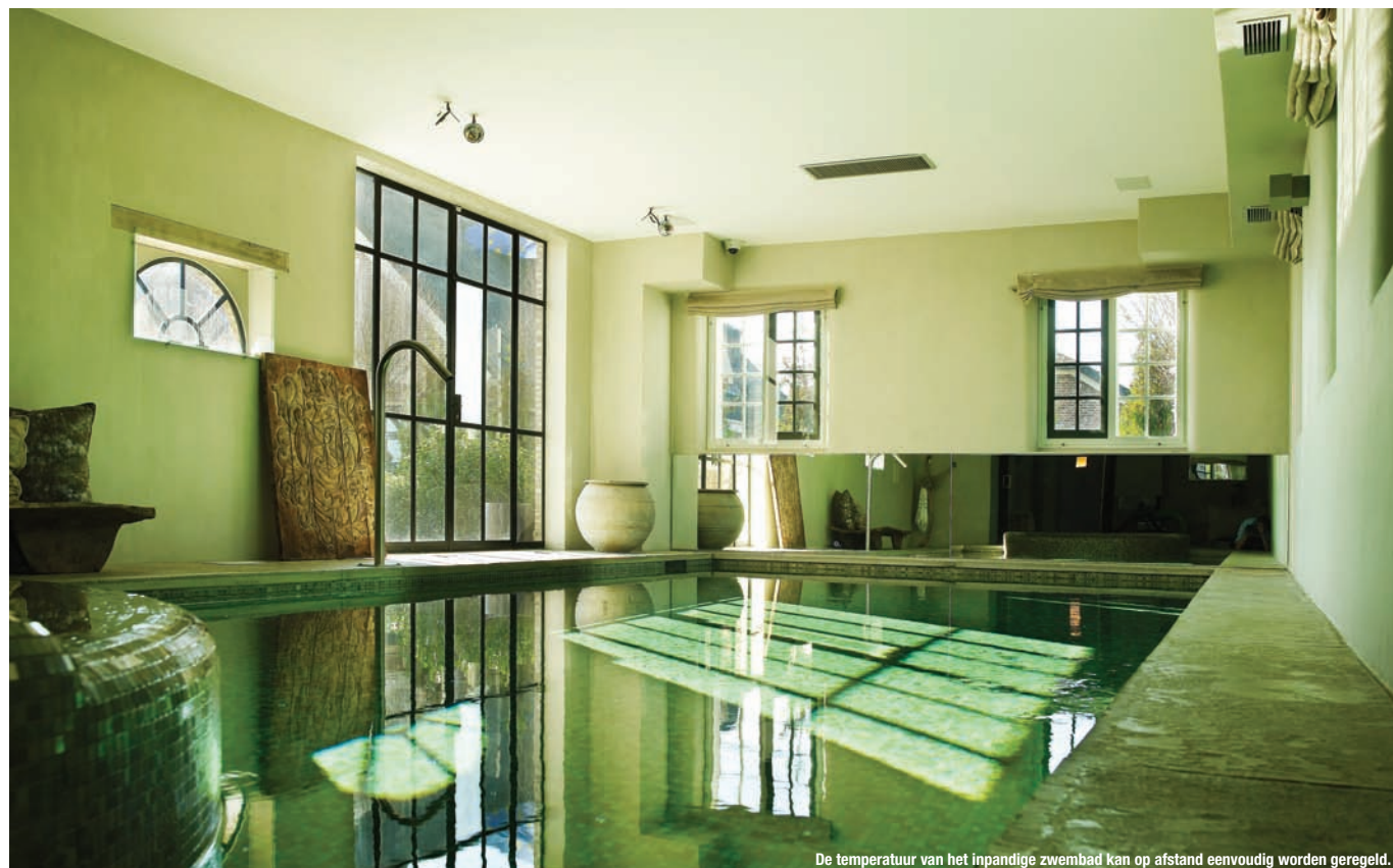
De temperatuur van het inpandige zwembad kan op afstand eenvoudig worden geregeld.