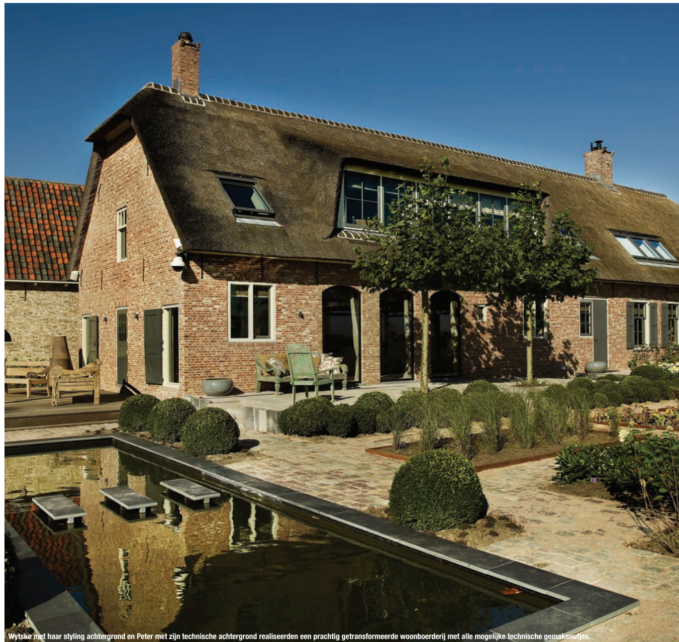
Wytske met haar styling achtergrond en Peter met zijn technische achtergrond realiseerden een prachtig getransformeerde woonboerderij met alle mogelijke technische gemaksnuffjes.