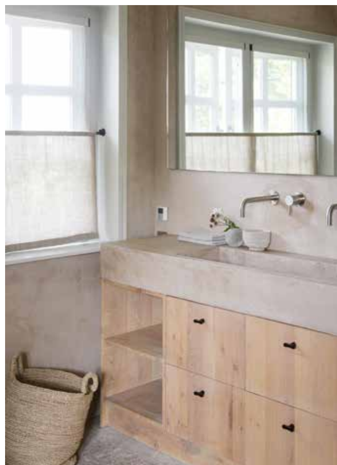
De badkamer bij de master-bedroom biedt volop privacy. Het wastafelmeubel is gemaakt van eikenhout met een blad in betonafwerking.

“Inmiddels ben ik gewend aan de lichte kleuren, ik zou niet anders meer willen”