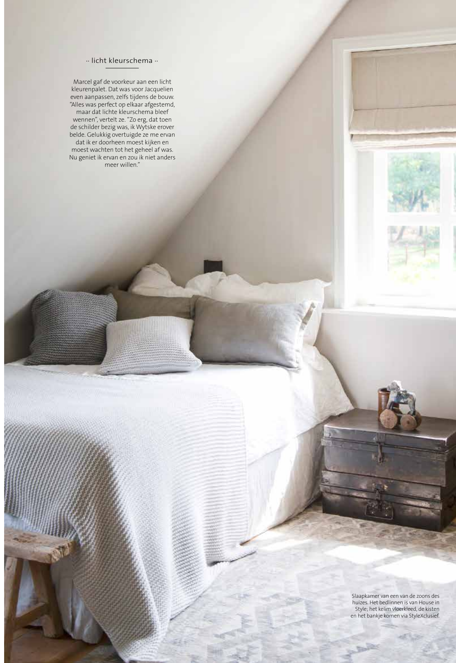
Slaapkamer van een van de zoons des huizes. Het bedlinnen is van House in Style; het kelim vloerkleed, de kisten en het bankje komen via StyleXclusief.