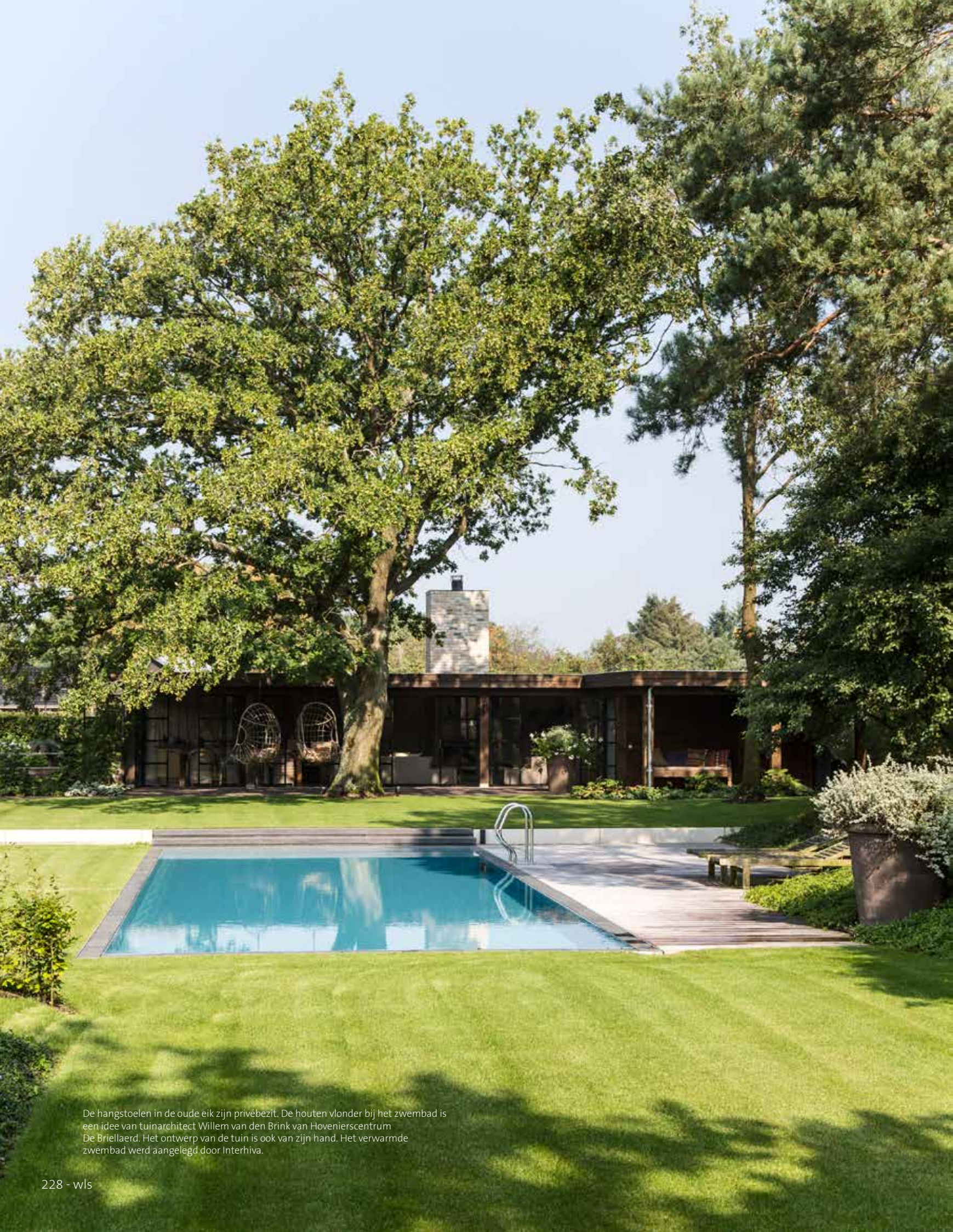
De hangstoelen in de oude eik zijn privébezit. De houten vlonder bij het zwembad is een idee van tuinarchitect Willem van den Brink van Hovenierscentrum De Briellaerd. Het ontwerp van de tuin is ook van zijn hand. Het verwarmde zwembad werd aangelegd door Interhiva.