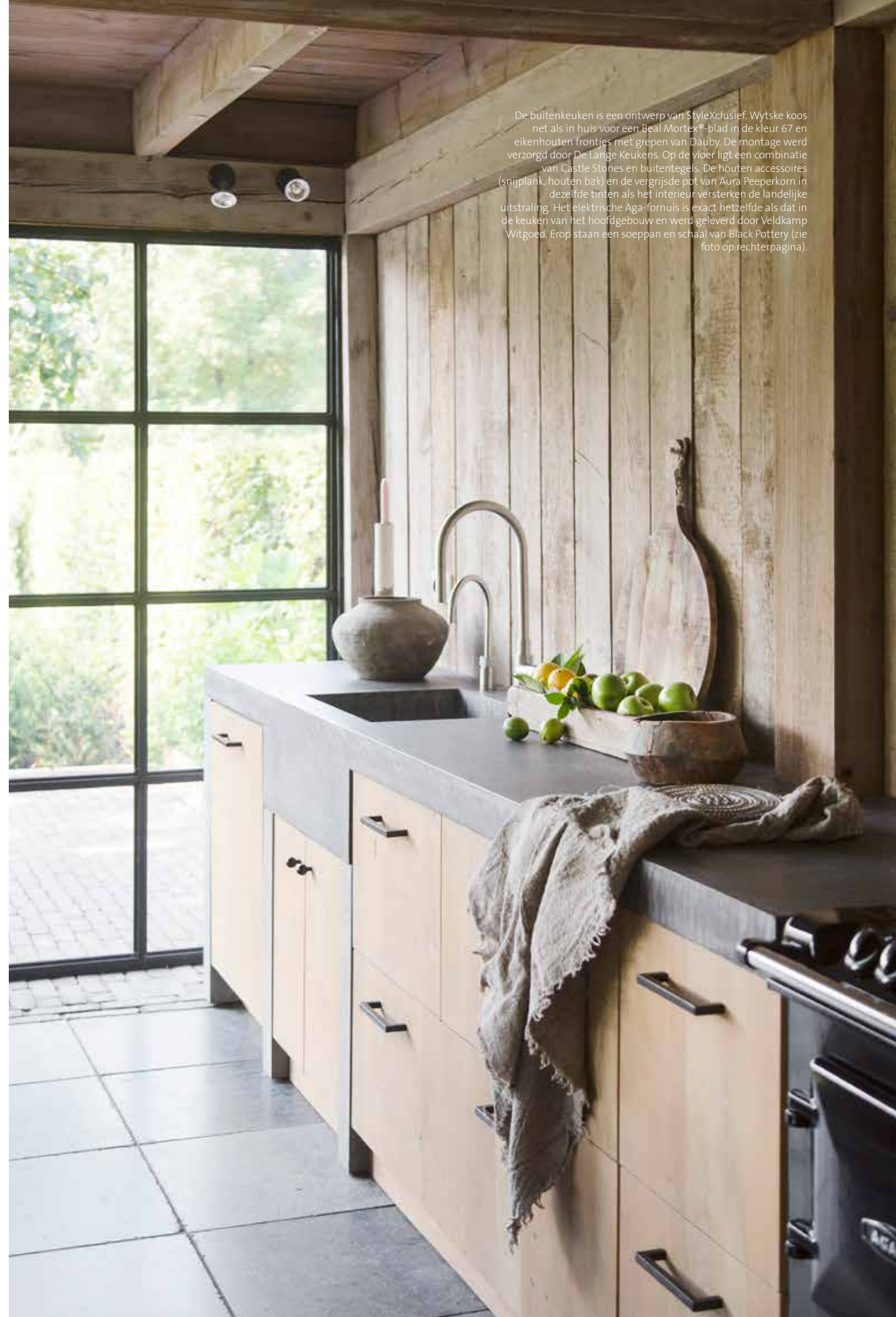
De buitenkeuken is een ontwerp van StyleXclusief. Wytske koos net als in huis voor een Beal Mortex®-blad in de kleur 67 en eikenhouten frontjes met grepen van Dauby. De montage werd verzorgd door De Lange Keukens. Op de vloer ligt een combinatie van Castle Stones en buitentegeles. De houten accessoires (snijplank, houten bak) en de vergrijsde pot van Aura Peepkorn in dezelfde tinten als het interieur versterken de landelijke uitstraling. Het elektrische Aga-fornuis is exact hetzelfde als dat in de keuken van het hoofdgebouw en werd geleverd door Veldkamp Witgoed. Erop staan een soeppan en schaal van Black Pottery (zie foto op rechterpagina).