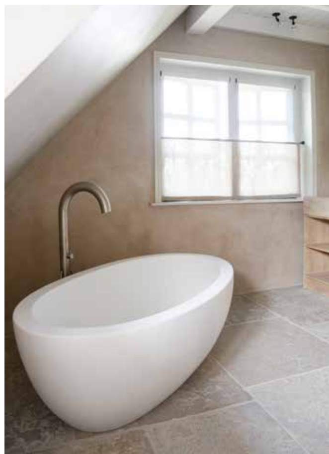
Het bad en de badkraan zijn van Jee-O (via StyleXclusief).