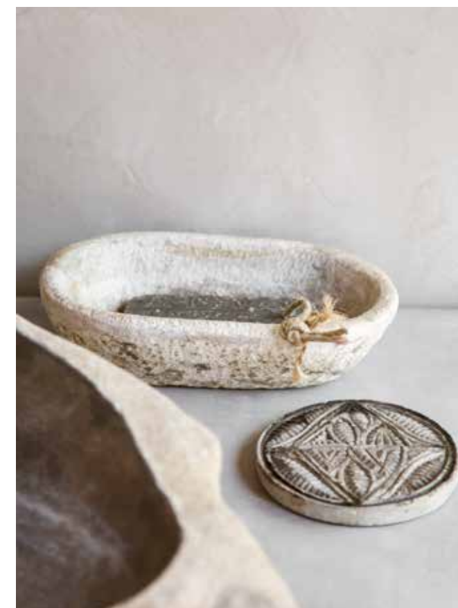
In het badhuis is een royale douchehoek gemaakt, waar de bewoners vanaf het zwembad zo naartoe kunnen lopen. In de douchehoek ligt Beal Mortex® op de vloer, met daaronder vloerverwarming. Zowel het wasmeubel als de muren zijn afgewerkt met Beal Mortex® in de kleur 07. De rvs kranen, de stenen onderzetter, het zeepbakje en het houten bankje komen via StyleXclusief; de handdoeken zijn van House in Style, de wasmand van Earthware. Al het houtwerk in het badhuis is geschilderd met grijs wit, kleur Ashes van Pure & Original.