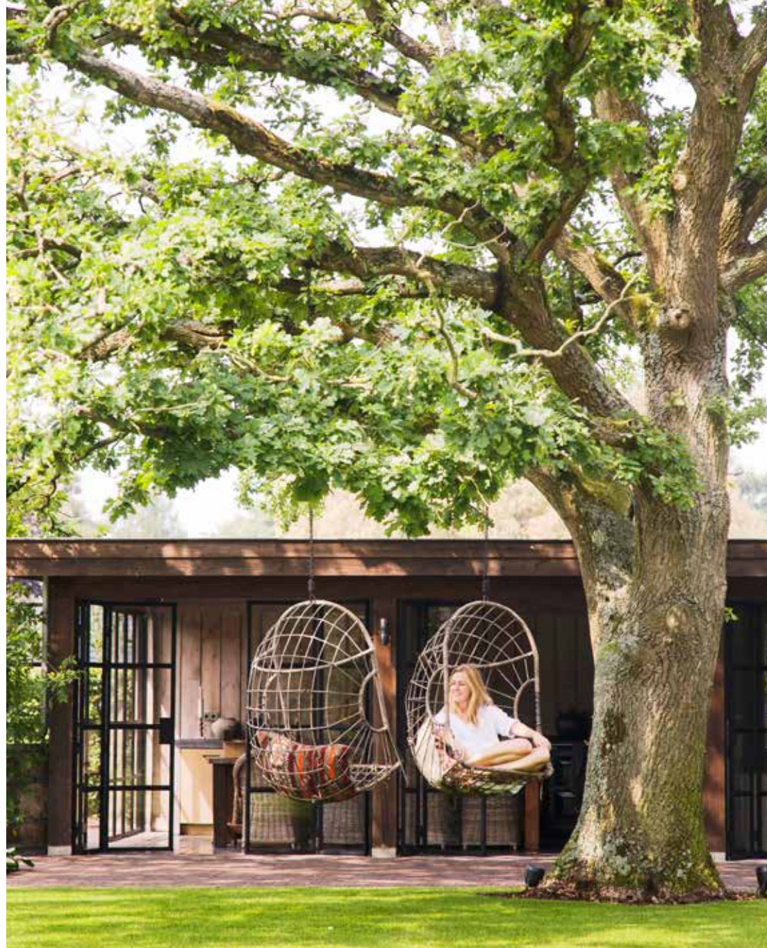
Het oude tuinhuis werd verbouwd tot badhuis door Kroon montage & afbouw. De staal-glasdeuren zijn op maat gemaakt door Patrick Snoeren Bouw en Interieur. De deuren kunnen naargelang de behoefte worden opengeschoven.

“Het fijne van deze plek is dat je hier zo het bos in loopt”