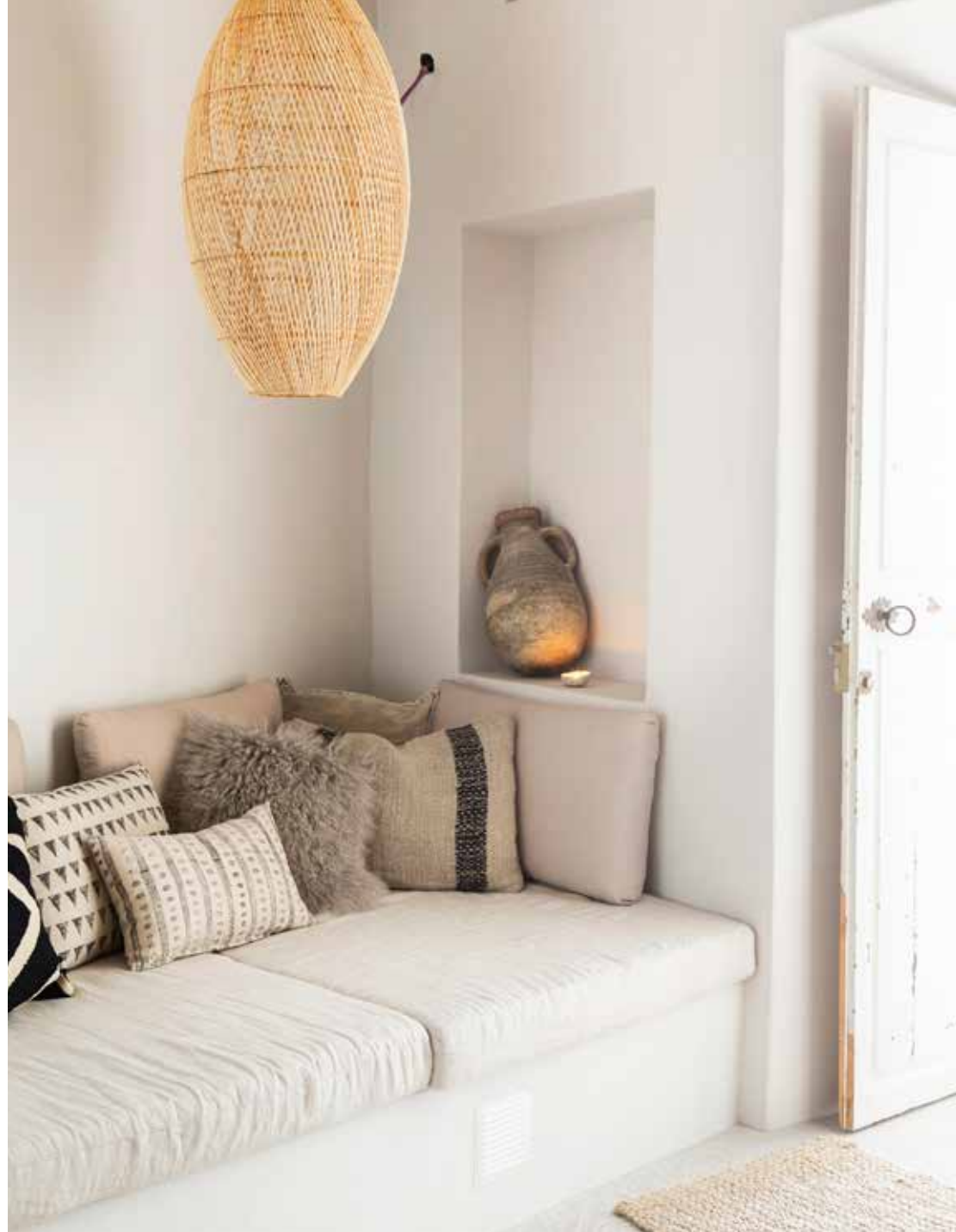
De oude waterkruik is van TC Style. Wytske had deze kruik al jaren in haar huis in Nederland, maar vond er nooit het perfecte plekje voor. Hier lijkt de kruik zich echter helemaal thuis te voelen.