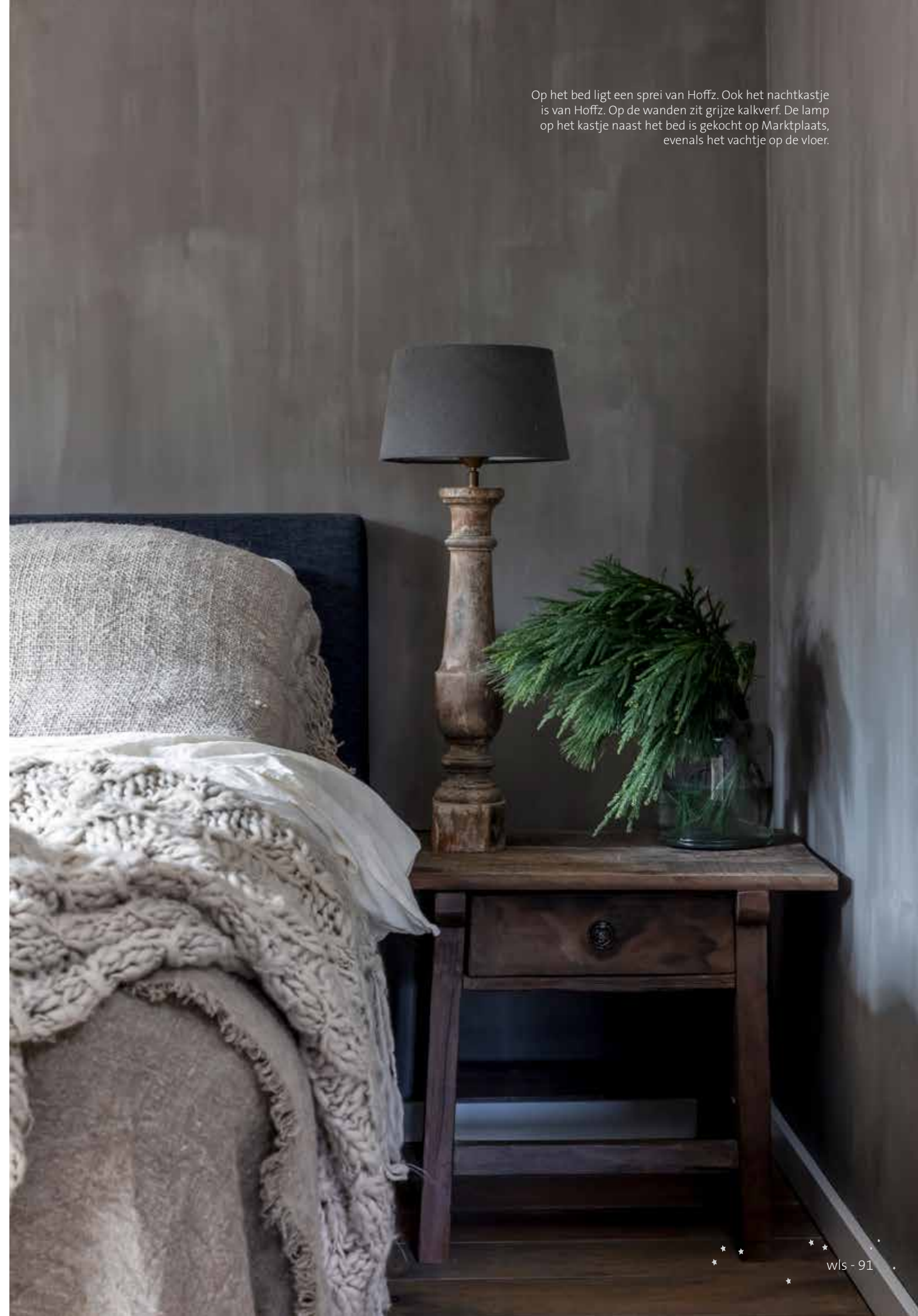
Op het bed ligt een spreij van Hoffz. Ook het nachtkastje is van Hoffz. Op de wanden zit grijze kalkverf. De lamp op het kastje naast het bed is gekocht op Marktplaats, evenals het vachtje op de vloer.

“We hebben nu een ontzettend sfeervolle woning”