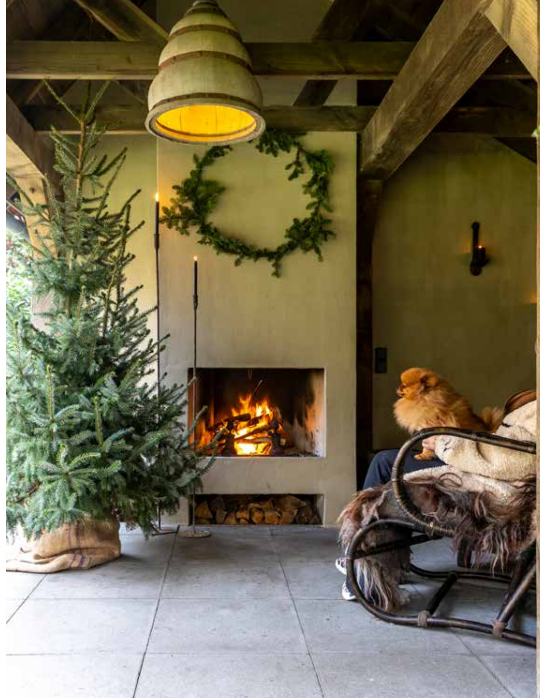
De kapschuur met de gezellig brandende open haard. De rieten stoel is van Hoffz, de plafondlamp van Hoffz is gekocht bij De Wilgengarde. De kandelaren naast de kerstboom zijn van Hoffz (via Het Wase Woonhuis). De groenkrans maakte Marianne zelf.

speciaal. Want er staan veel oude bomen, waaronder veel naaldbomen en met name als het een beetje mistig is, krijgt de omgeving iets mystieks en voelt het alsof je deel uitmaakt van een winterwonderland-decor. En je kunt het wel aan Marianne overlaten om die specifieke sfeer extra te benadrukken met prachtige, subtiele groendecoraties. “Daar begin ik rond 5 december mee. Ik koop grote en kleine kerstbomen voor in huis,