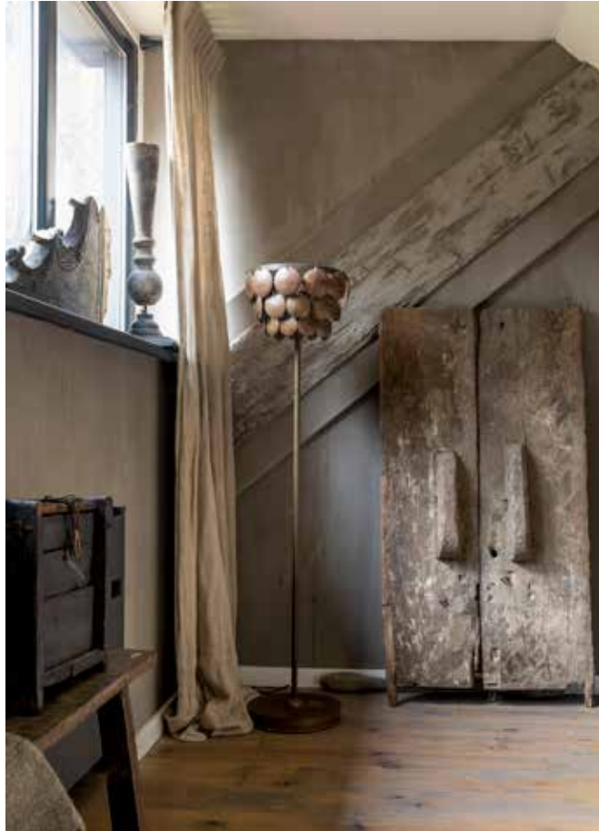
Het krukje onder het raam, de houten panelen tegen de muur, de gordijnen en de staande lamp zijn van Hoffz.