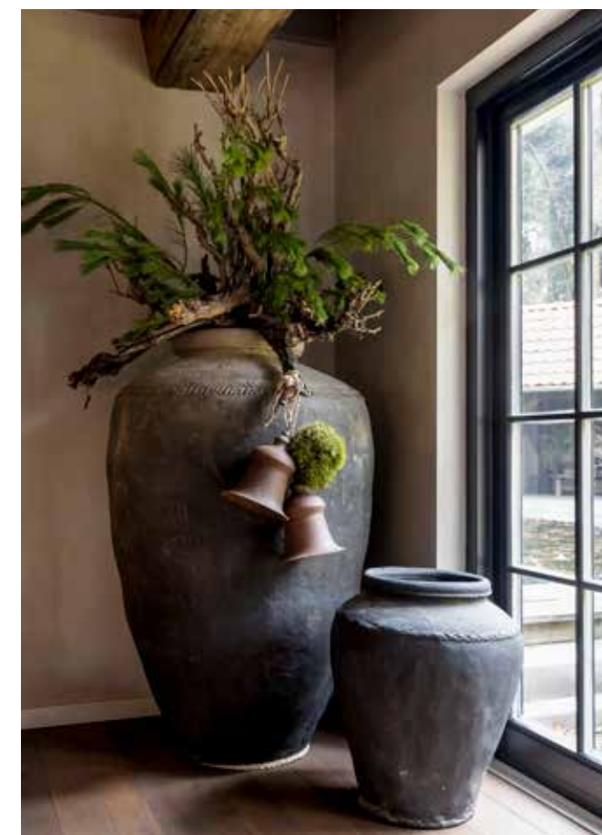
De grote potten komen van Landelijk Sober Wonen. De kerstklokken zijn bij Intratuin gekocht.

“Ik koop grote en kleine kerstbomen voor in huis, op het terras en onder de veranda van de kapschuur”