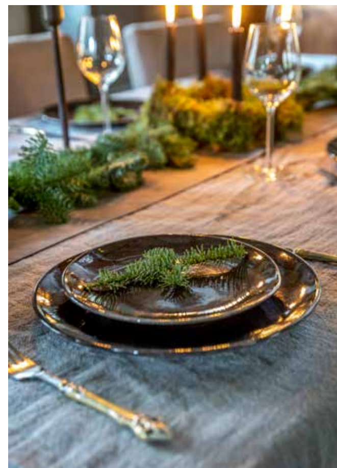
De eettafel is gedekt met servies van Broste Copenhagen. Het tafelkleed is van Hoffz. Het bestek en de glazen kocht Marianne bij Intratuin.