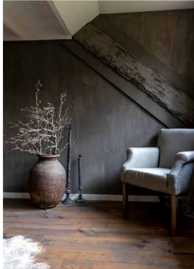
Een sfeerhoekje in de slaapkamer met een fauteuil, een pot van Hoffz en kandelaars via Landelijke Stijl en Wonen.