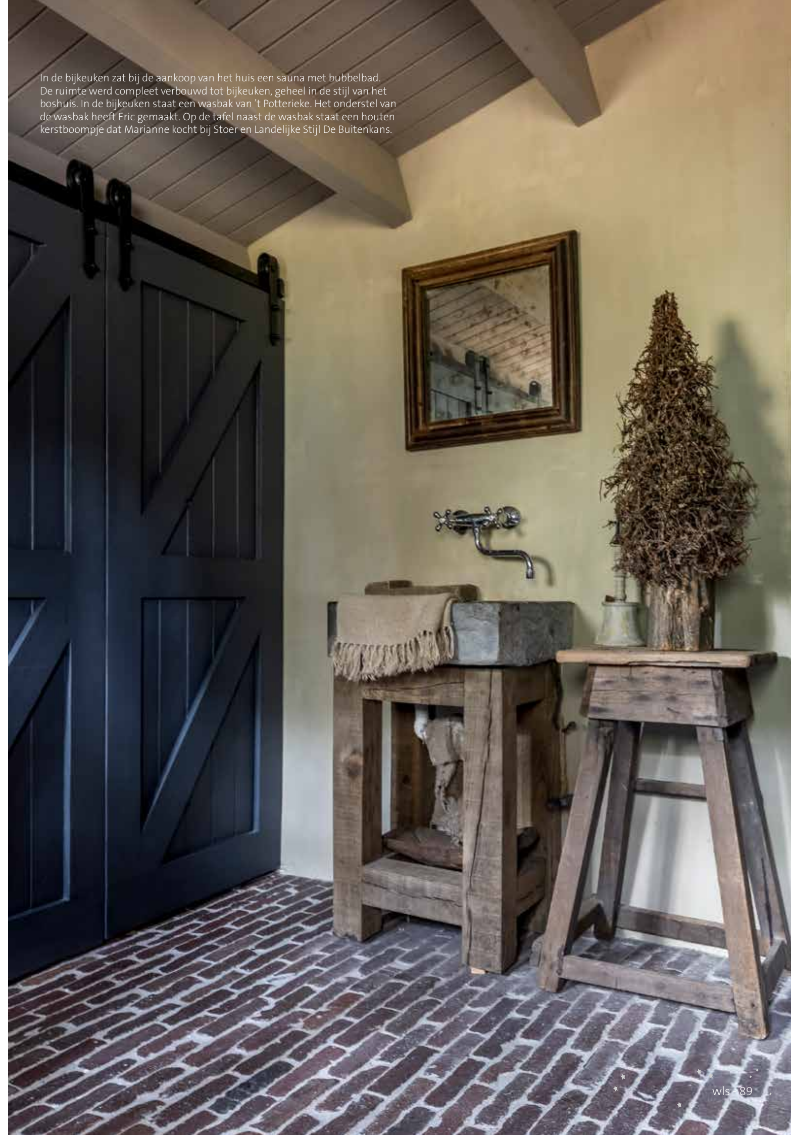
In de bijkeuken zat bij de aankoop van het huis een sauna met bubbelbad. De ruimte werd compleet verbouwd tot bijkeuken, geheel in de stijl van het boshuis. In de bijkeuken staat een wasbak van 't Potterieke. Het onderstel van de wasbak heeft Eric gemaakt. Op de tafel naast de wasbak staat een houten kerstboompje dat Marianne kocht bij Stoer en Landelijke Stijl De Buitenkans.