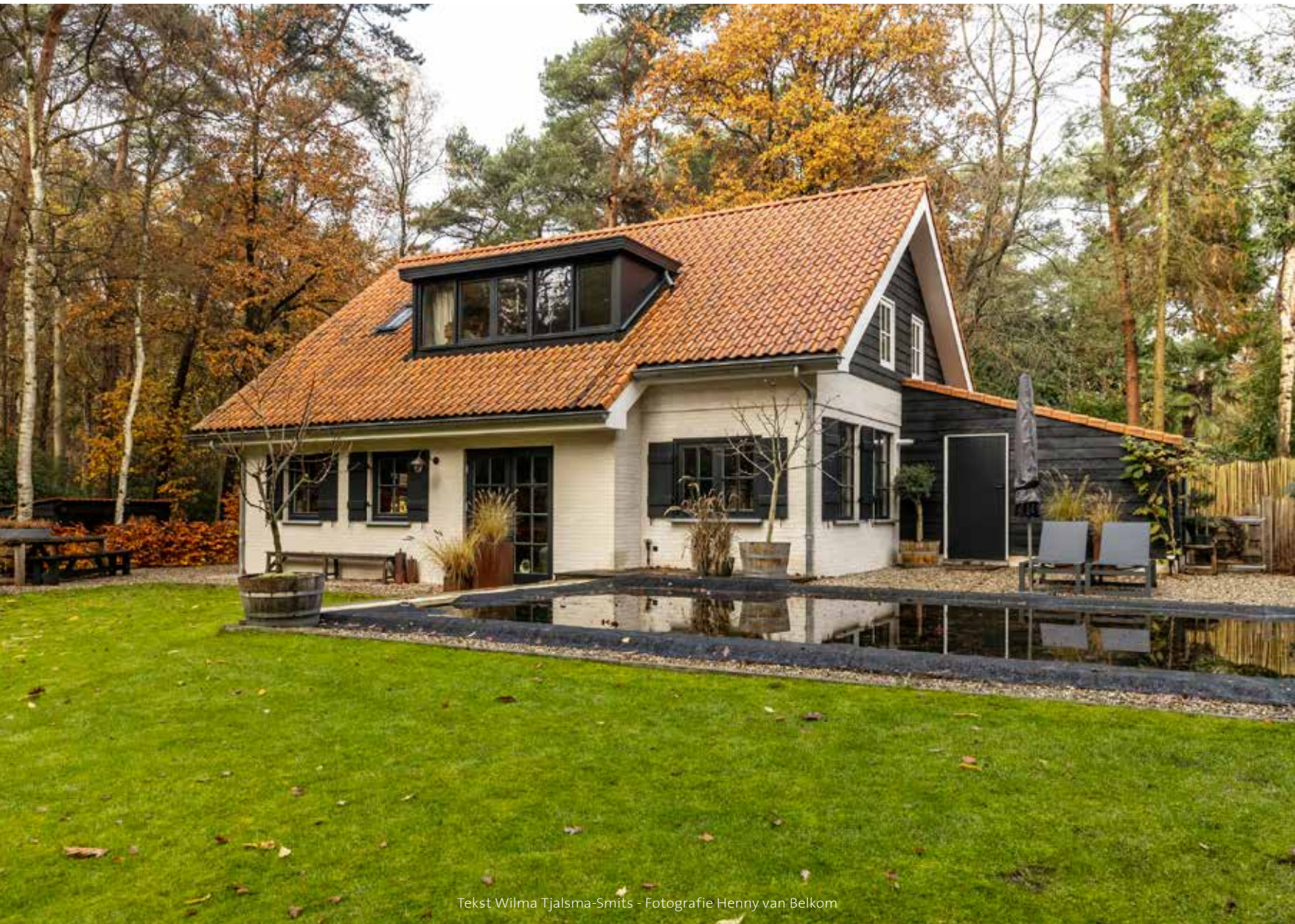
Tekst Wilma Tjalsma-Smits