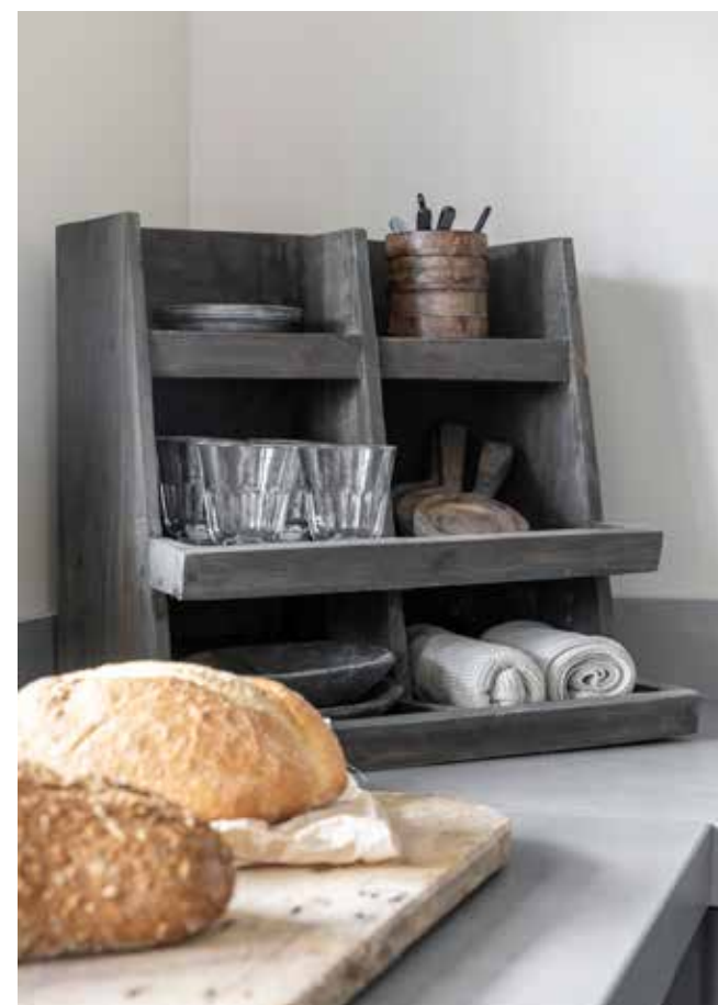
Het houten voorraadkistje op het aanrecht komt van Landelijk en Sober Wonen.

Inge: "Een keuken is zo'n belangrijk onderdeel van je huis, daarvoor wilden we een goed advies. Eerst zochten we een houten keuken, maar daarvan kwamen we terug omdat het dan – samen met de eettafel – te houterig werd. Dit ontwerp vinden we over vijf jaar nog steeds mooi."