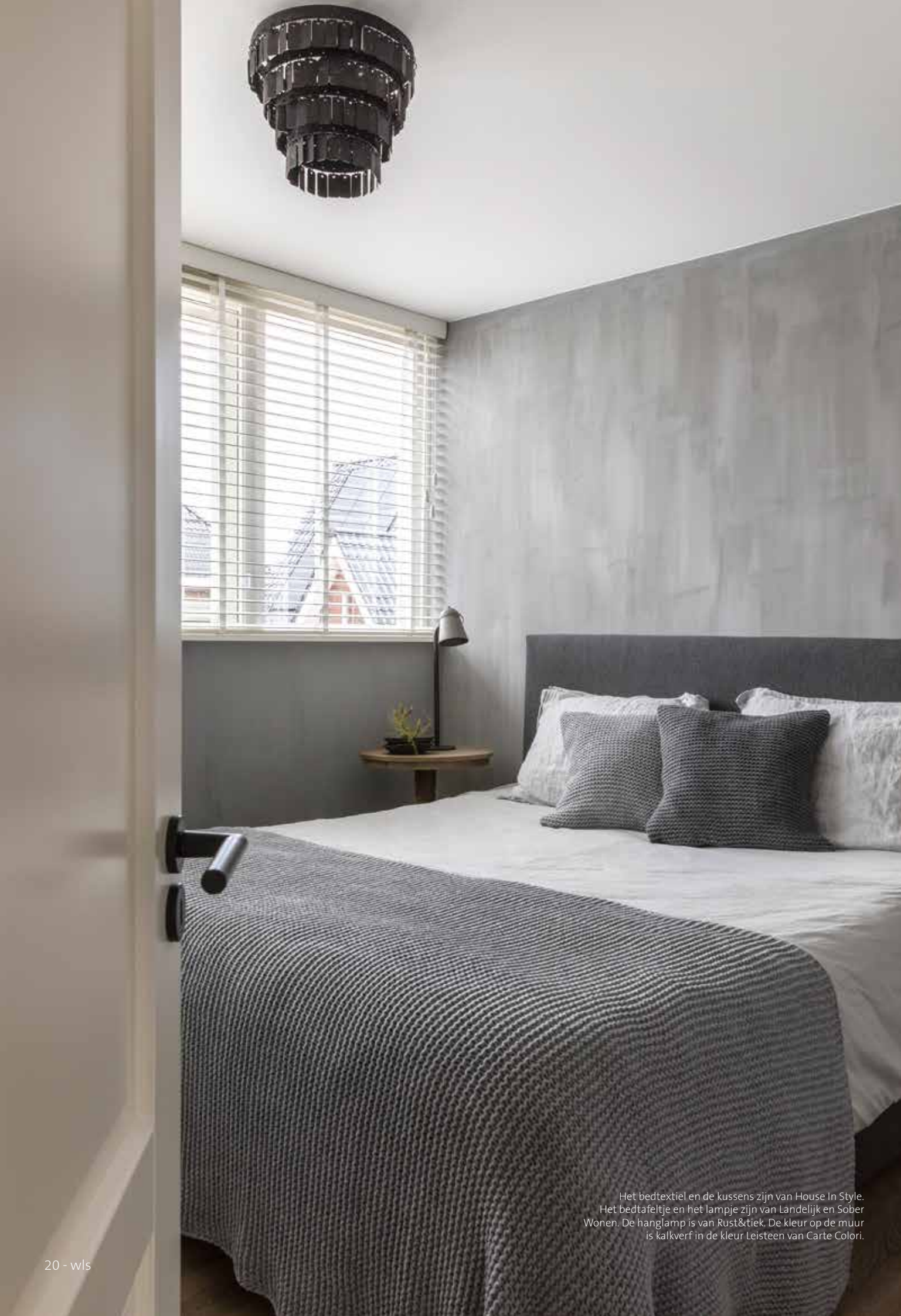
Het bedtextiel en de kussens zijn van House In Style. Het bedtafeltje en het lampje zijn van Landelijk en Sober Wonen. De hanglamp is van Rust&Tiek. De kleur op de muur is kalkverf in de kleur Leisten van Carte Colori.