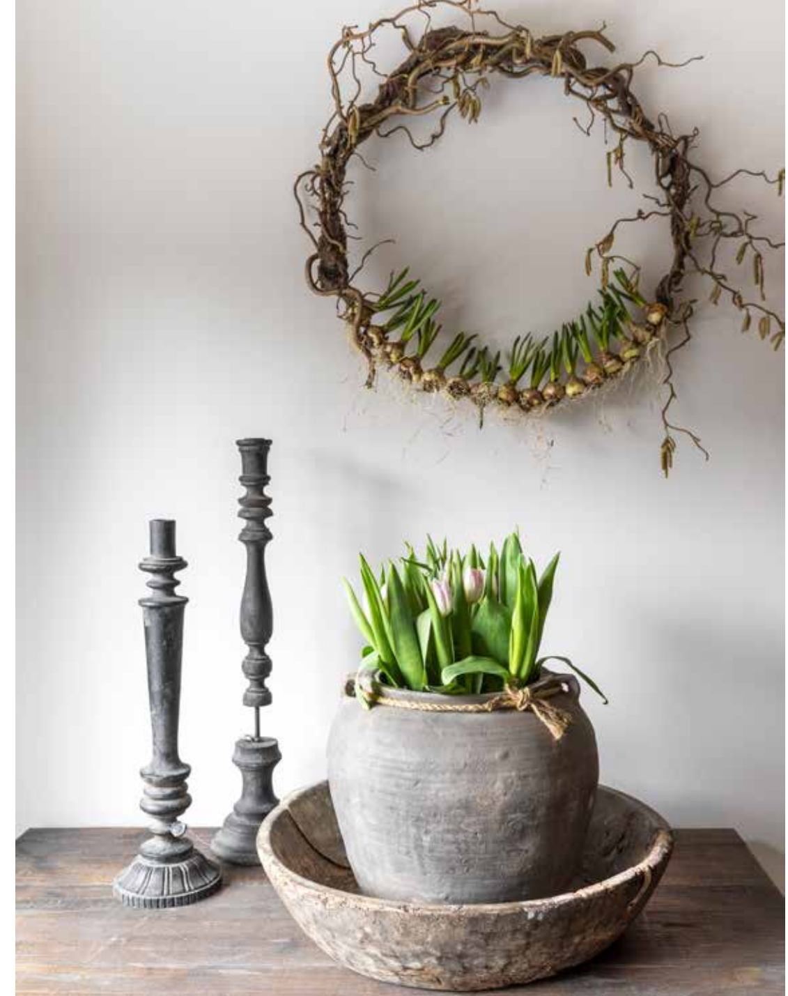
De krans is van VOC 2012.