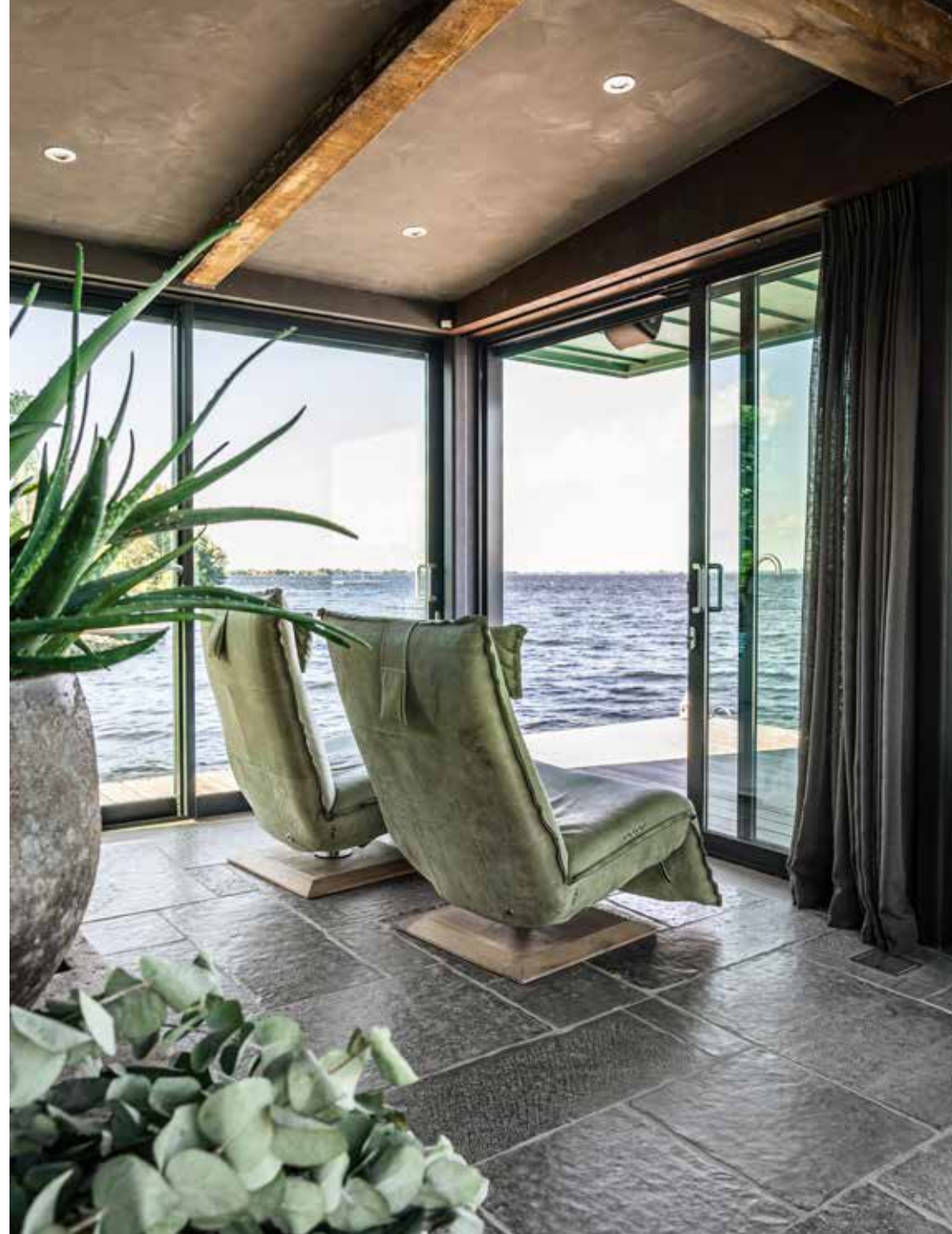
De gordijnen en de lichtgroene, leren stoelen zijn van Nijhof.