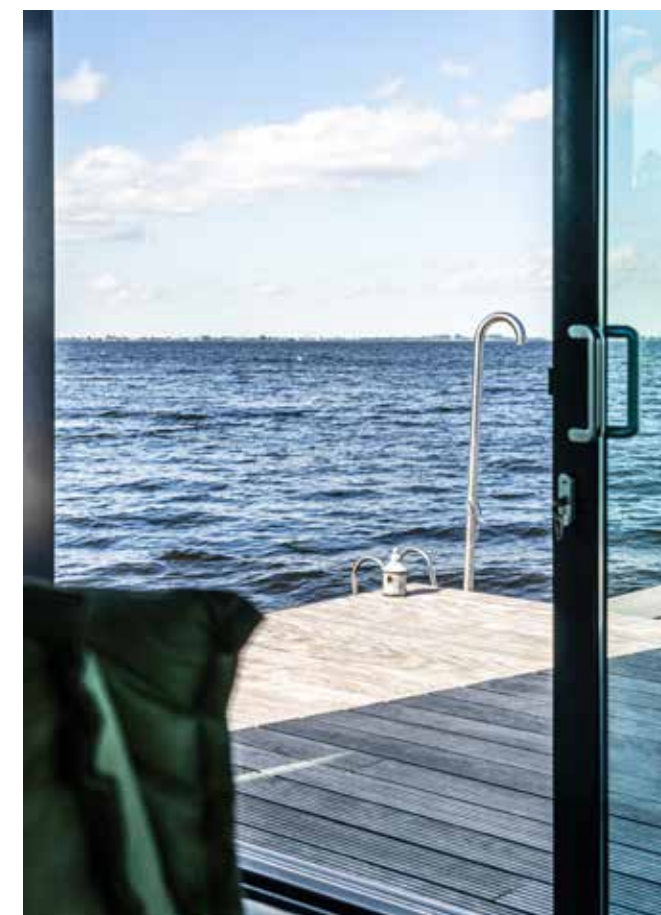
Aan de linkerkant zijn 32 betonnen elementen geplaatst, als een soort damwand. Deze beschermt de ark bij harde wind tegen het water. De ark wordt omgeven door een houten vlonder.

“De groenige tint van geoxideerd koper past perfect bij grijze leisteen”